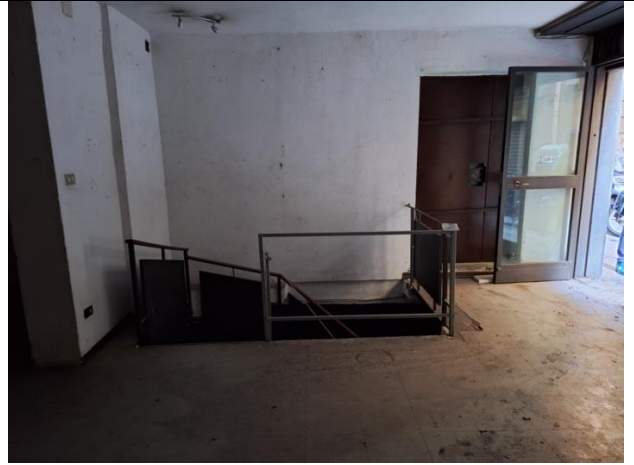
Scala per il piano interrato