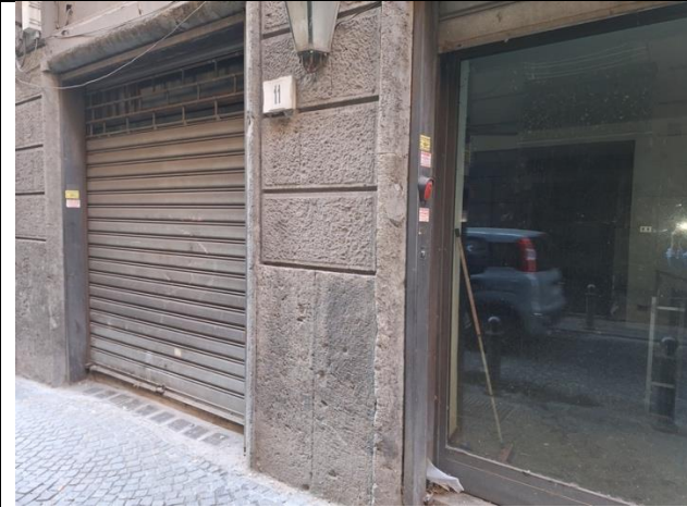
Vetrine fronte strada