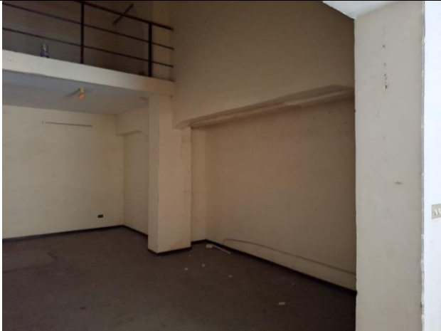
Lato interno e soppalco