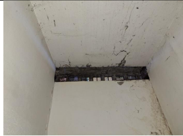
Preso d'aria piano interrato