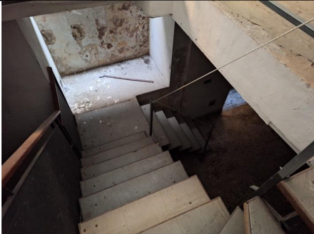
Scala per piano interrato