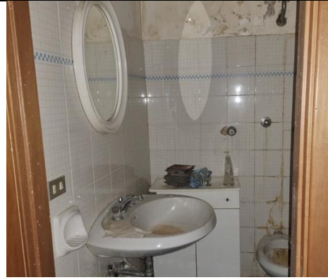
WC piano interrato